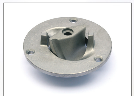
Macht kurzen Prozess mit Feststoffen: das gehärtete Edelstahl-Schneidwerk (HRC 55) der GRP-Baureihe