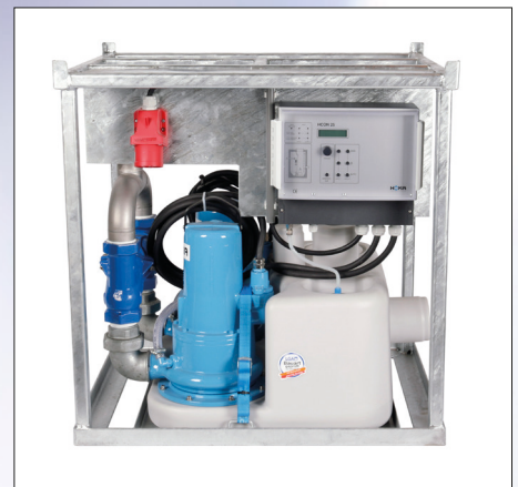
Leichtes handling, kompakte Abmessungen: 60 x 80 x 80 (BxLxH)